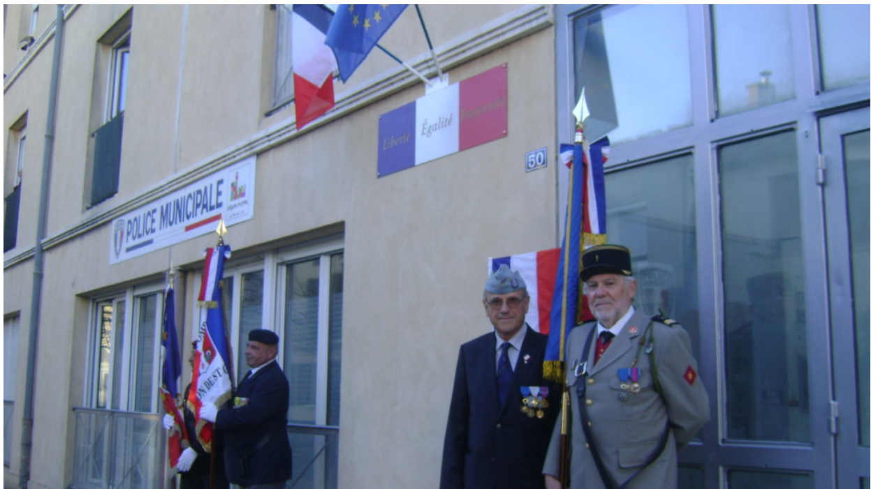
Cérémonie d'inauguration du commissariat de police d'Aigues Mortes (25 mars 2019)