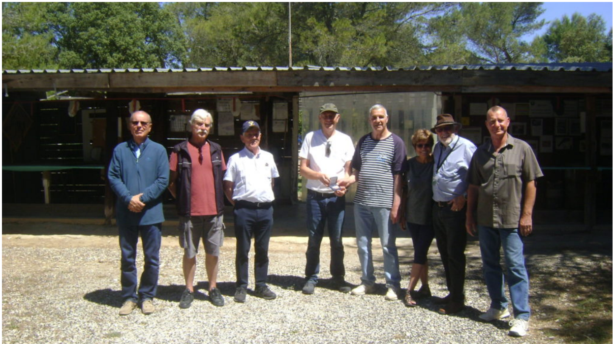
Remise de la médaille du centenaire de l'ADORAC du Gard au Président de la Société de Tir de Langlade (13 juin 2019)